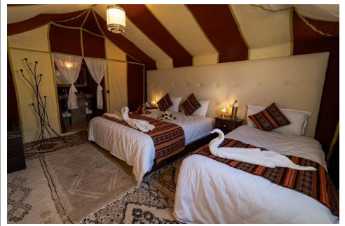
梅爾祖卡沙漠豪華營地 Merzouga Luxury Desert Camp