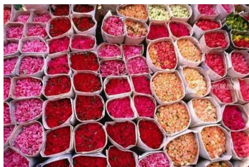
玫瑰谷 Valley of Rose