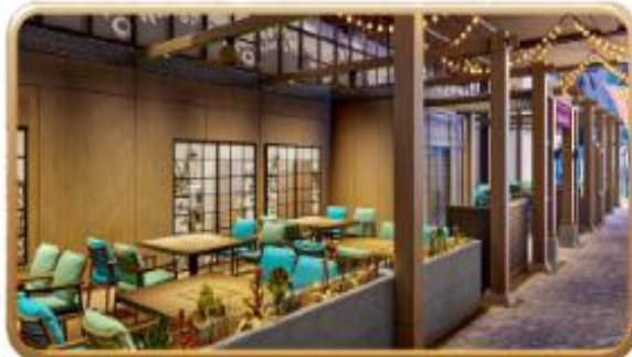
Mike & Sulley's