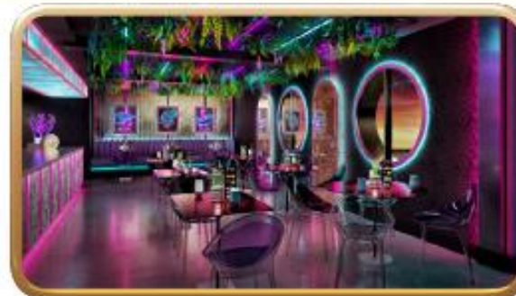
Bewitching Boba & Brews

為遵守『商品說明條例』，本公司已即時將所有旅遊產品內需要額外支付之膳食及額外之入場費用『清清楚楚』列明於單張內，以保障消費者權益，這是EGL公司之文化！！