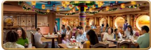
Enchanted Summer Restaurant