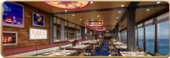
Pixar Market Restaurant