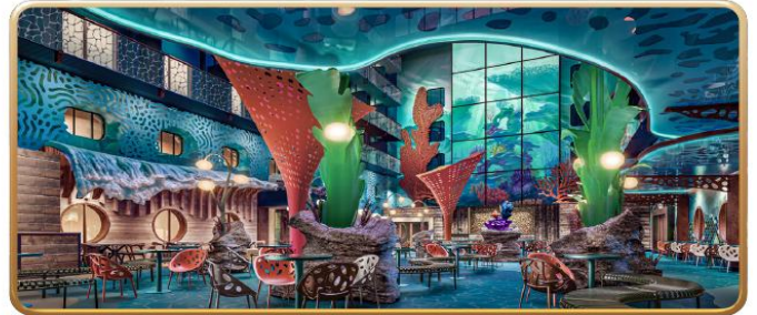
Disney Discovery Reef