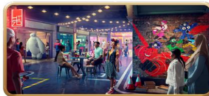
San Fransokyo Street