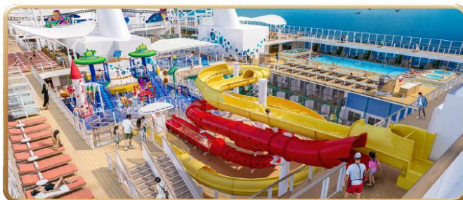
Toy Story Place