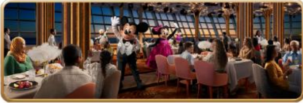
Hollywood Spotlight Club