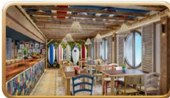
Stitch's 'Ohana Grill