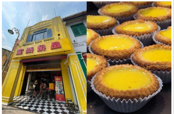
慢活馬來之百年品泉茶室 【打卡熱點】【特色唐餅,咸+甜各一件+特飲品一杯】