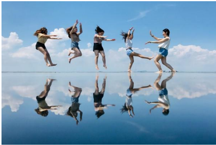
馬來西亞"秘境" ~ 『天空之鏡』