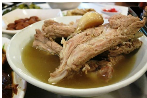
半百年肉骨茶專賣店"新峰肉骨茶"