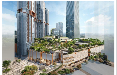
Exchange 106 TRX商場