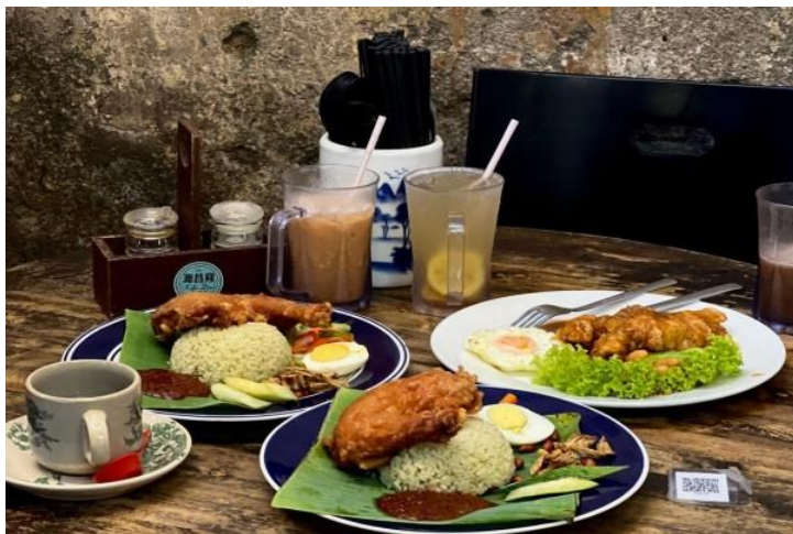
生炸雞牌班蘭椰漿飯