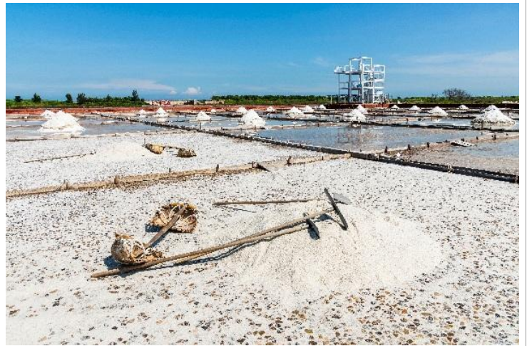
【井仔腳瓦盤鹽田】 台灣現存最古老的瓦盤鹽田遺址