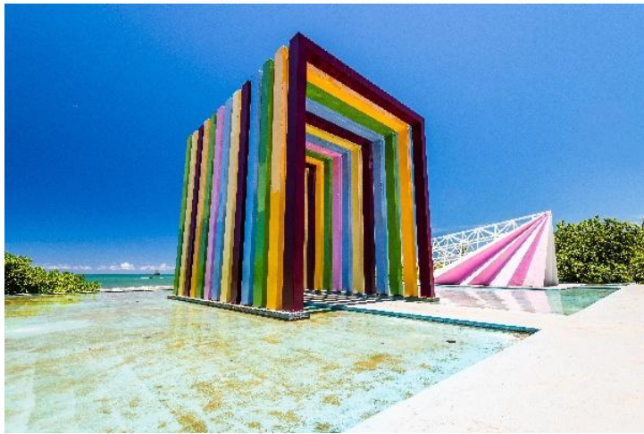
旗津半島人氣打卡點 【彩虹教堂】