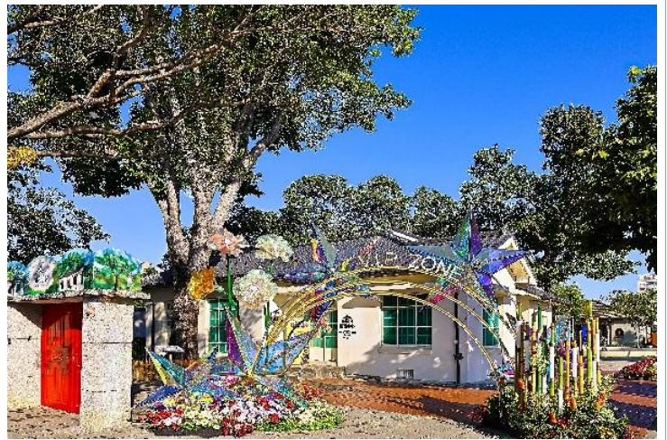
【勝利星村創意生活園區】