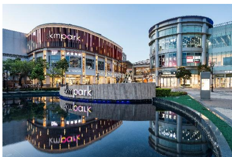
高雄草衙 SKM Park Outlets購物中心