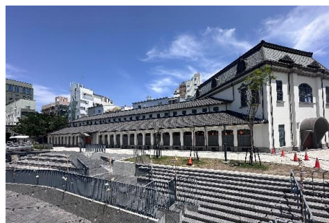
最美的大菜市傳統市場 【台南西市場】