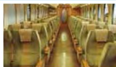
普通座位(兩側雙座)