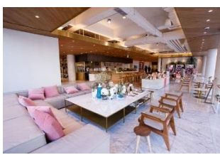
SM Ent. SUM Cafe