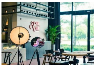
JYP Ent. Soul Cup Cafe