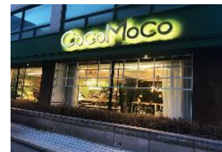
韓劇<她的私生活>取景地 CocoMoco咖啡店