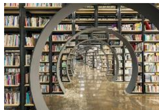
韓劇<德魯納酒店>取景地 首爾書寶庫