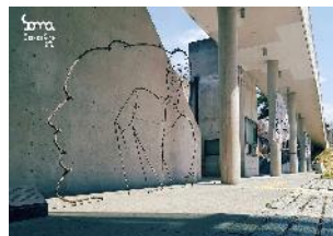
韓劇<她的私生活>取景地 SOMA美術館