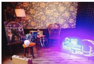
韓劇<德魯納酒店>取景地 Hotel SEINE